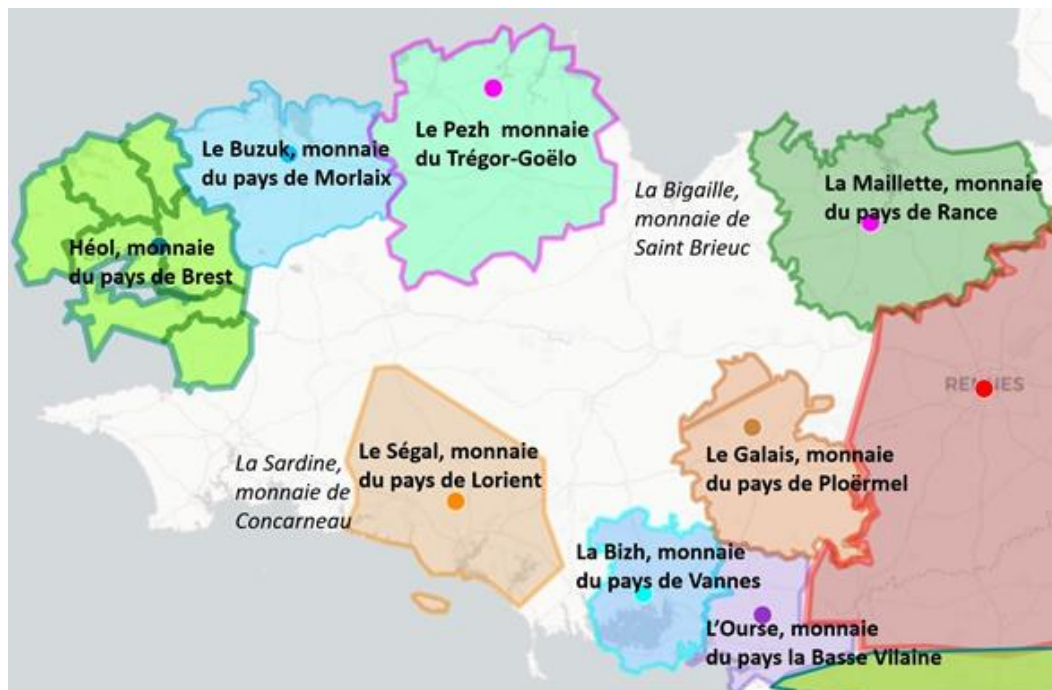
Figure 1: diffusion géographique des différentes monnaies bretonnes